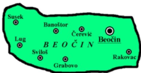
Слика број 2: Насеља у општини Беочин,

Черевих је село које је саграђено на ушћу Черевихког потока у Дунав. Спада у подунавско насеље. Село је 7 км удаљено од општинског центра.